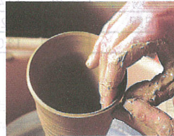
<ゆのくにの森 ろくろ回し>